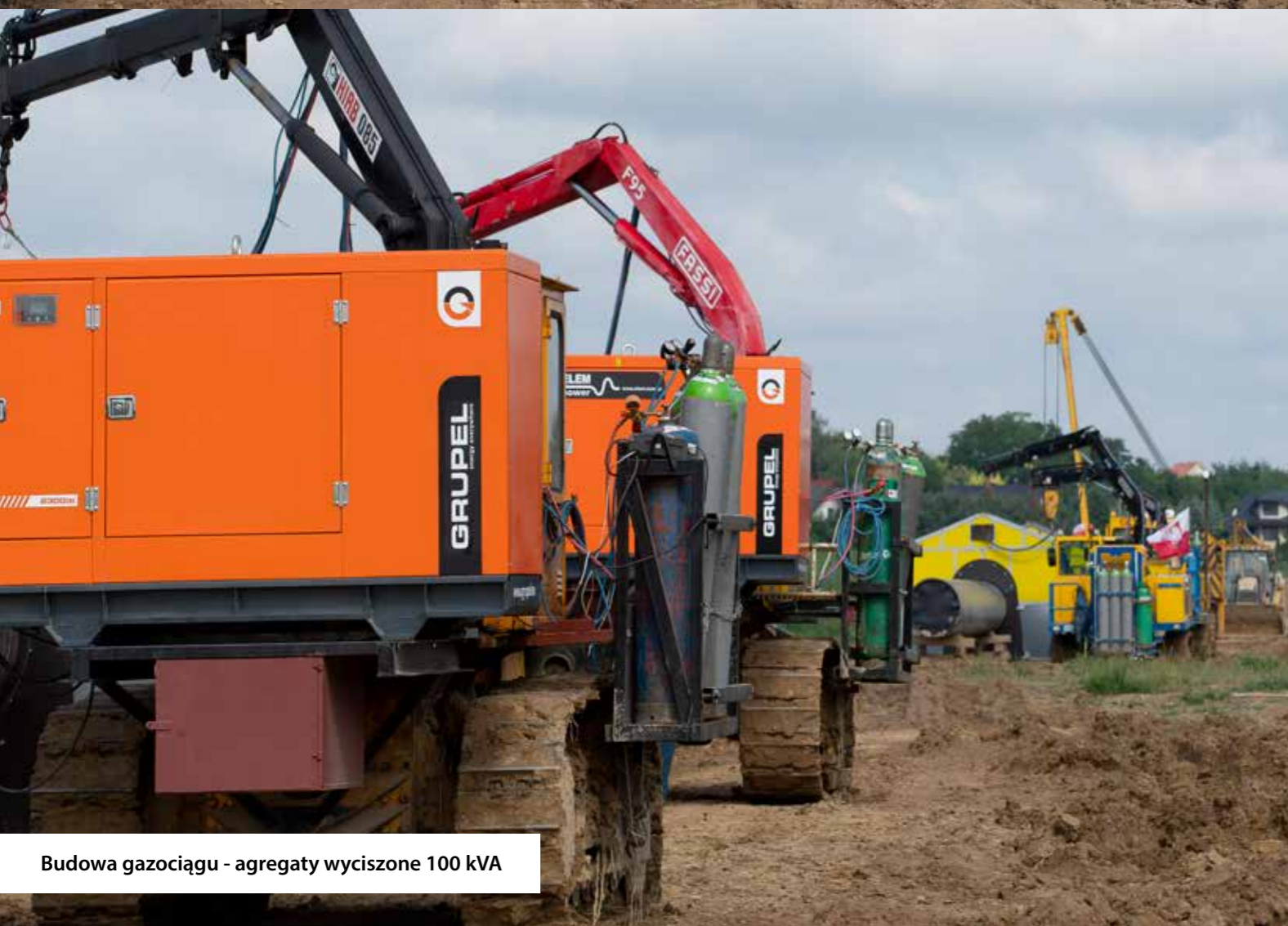
Budowa gazociągu - agregaty wyciszzone 100 kVA