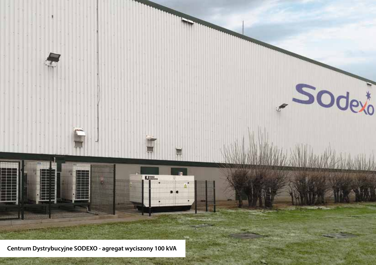
Centrum Dystrybucyjne SODEXO - agregat wyciszony 100 kVA