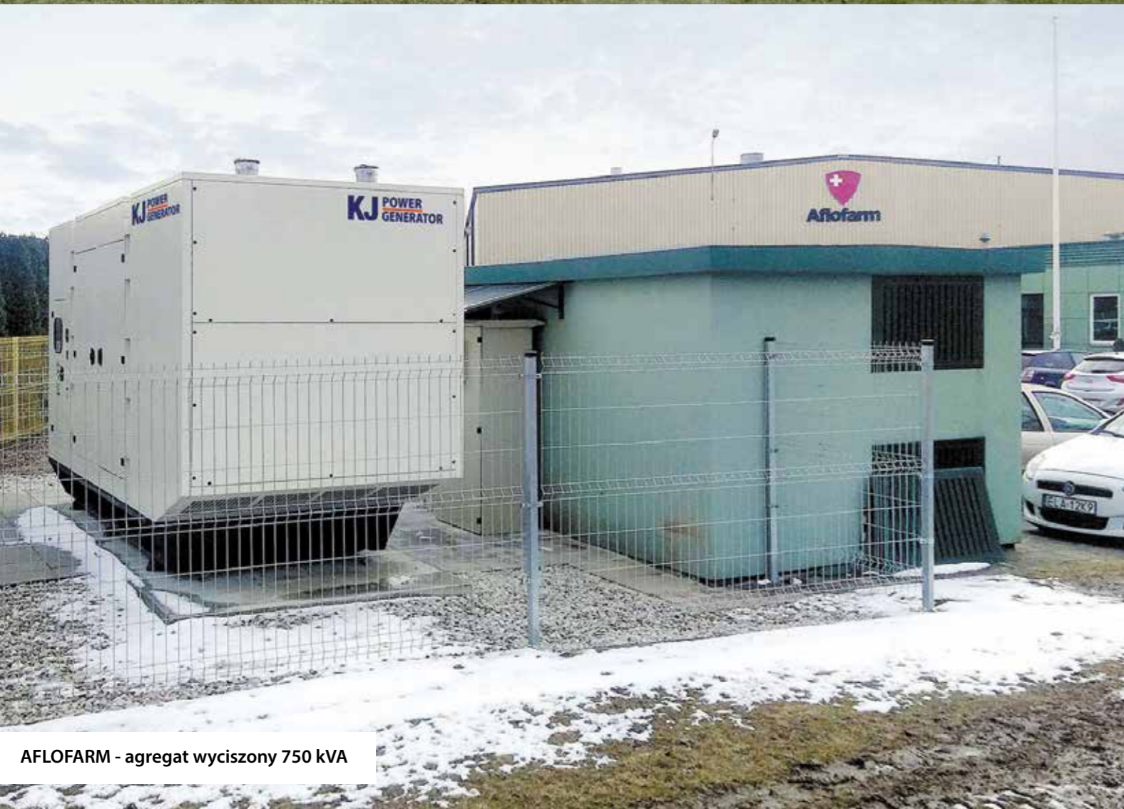
AFLOFARM - agregat wyciszony 750 kVA